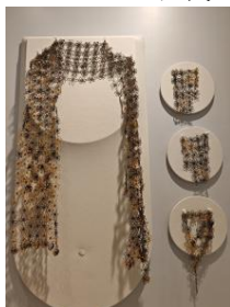
Plutalai Fai Pha-neang