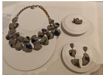
Beauty that Transcends Time