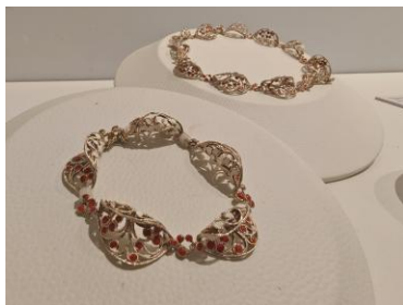
Sukho Fine Art Necklace

泰国蓝宝石是世界宝石市场的重要组成部分，分布在泰国北部和东部地区，以庄他武里府的宝石产区最为著名，每年吸引全球各地的珠宝商汇集于此，丰富的资源使蓝宝石被广泛应用于高端珠宝设计。与此同时泰国设计师尤为青睐紫水晶、黄水晶、玫瑰石英等石英家族丰富的色彩表现力，对光学效应的精妙运用是另一大特色，长石家族的晕彩和闪烁效果，被巧妙地用于模仿自然界中水波、极光与阳光的微妙光泽。此外，泰国工匠也对如绿松石这类特色宝石进行娴熟处理，通过优化工艺增强其耐久性，展现了在吸纳全球宝石资源的同时，所进行的成功文化转译与在地化创新。