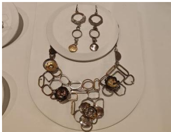
Loving Blooming Curves