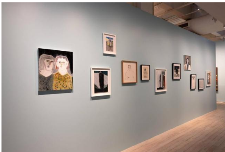
黄华晨-- oil on canvas, The Family Album—So See You Later, 2009–2012

照组成了一个看起来是幸福的虚假的家庭。通过画完全陌生的人，组合出了一个家庭相册。在家庭相册的中央，一个放置家庭中长辈画像的黑色相框中，是一幅关于缺席父亲的想象画。在这幅父亲画像的周围，不同形状和大小的画布让人想起 19 世纪沙龙中的画作。整组作品的色调非常统一，所有的油画都是比较素净的颜色。艺术家并没有用非常鲜艳的色调去突出虚假家庭的不和谐。看似温馨的重组家庭背后有着更深层次的故事反而更好的激发了观众探索的兴趣。