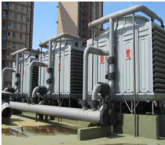
图 1: 建筑暖通空调系统示意图

暖通空调作为建筑内部中不可或缺的核心部分;简单来说,暖通空调水系统具备很强的灵活性与高效性等运行特征,能够满足建筑室内环境对于不同季节的供暖与冷却需求,主要是利用控制阀来根据实际需求进行调节,这种系统模式大大地提高了建筑能源的利用效率。在一般情况下,因为水的热传导能力相对较强,与空气系统而言,能够更加高效地进行热量与冷量的传递。总而言之,暖通空调水系统不仅能够大大地改善建筑室内的环境,同时也在节能以及环保等领域中表现出发展潜力,暖通空调系统如图 1 所见。