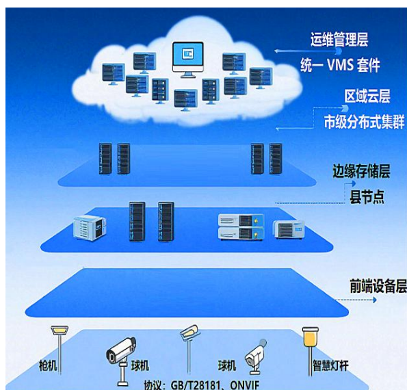
图 1：视频存储云系统典型架构图

(1) 前端设备层：含枪机、球机（如华为 M2241-EFL [6] ）、智慧灯杆，支持 GB/T 28181/ONVIF 协议；