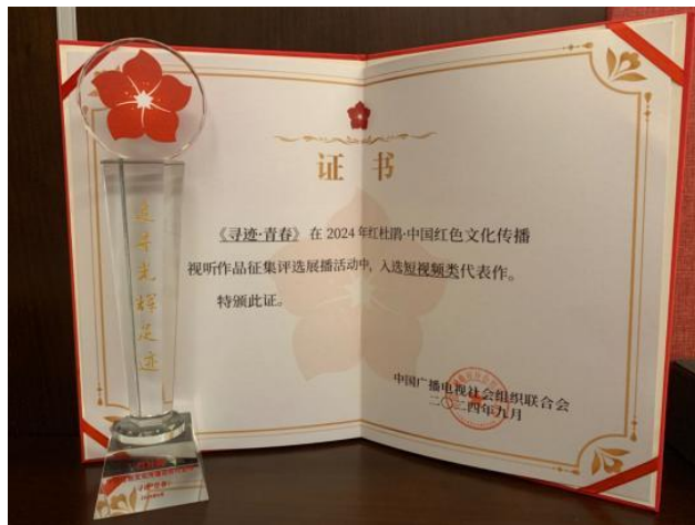
图 4 获奖证书

红色主题微电影需建立多渠道、多层次推广体系,我们制定“三步走”策略:一是校园落地,在思政课组织放映并开展讨论,转化为思政教学案例;二是专业展示,选送作品参与中国好创意、蓝桥杯等学科竞赛及红杜鹃红色文化传播评选等专业赛事,斩获多项奖项;三是社会传播,组织跨学院公映,提升社会层面讨论度与主创曝光率。