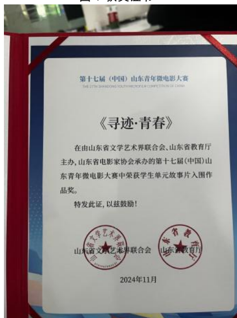
图 5 获奖证书