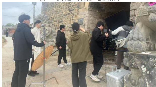
图 3 现场工作照