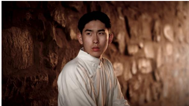
图 2 《寻迹·青春》电影截图

帧率 + 200ISO (高清细腻)。专业教师全程指导技术,如“雨幕转场”以高速摄影 + 雾气 + 人工降雨强化气氛,城市场景用“数字抠像合成技术”凸显人物思想转变,助力红色叙事摆脱单一纪实风格与粗粝质感,增强视觉冲击力。