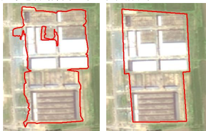
图 2-2. 左边为原始图斑范围，右边为人工编辑后的图斑范围

变化图斑的界线按照当期影像上的变化范围进行检查，发现自动提取图斑范围线明显不合理时，人工对范围线进行编辑，如下图所示。